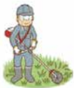
草機刈り 緑地管理