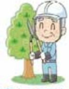
庭木の手入れ 樹木の伐採